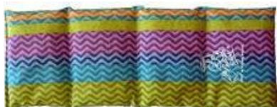
Trapuntato 4 tacche 500gr 16x44cm