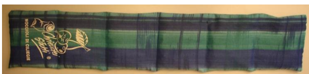
Trapuntato 6 tacche 780gr 16x66cm