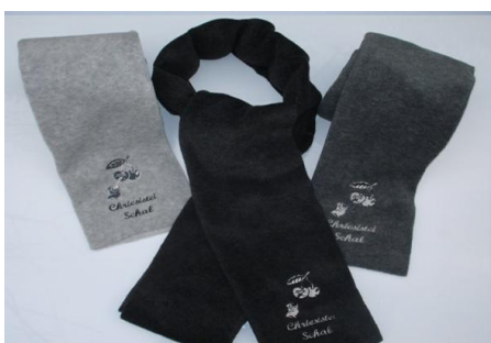
Sciarpa pile 160x15cm