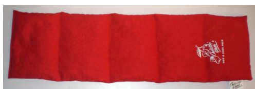
Trapuntato 5 tacche 650gr 16x55cm