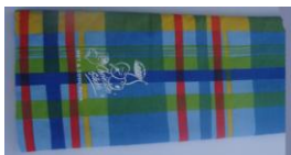
coolpack 400gr 14x24cm

Disponibili in diversi formati e fantasie per i gusti e le esigenze di tutti! Anche sfusi per confezionare da soli i cuscini che più vi piacciono!