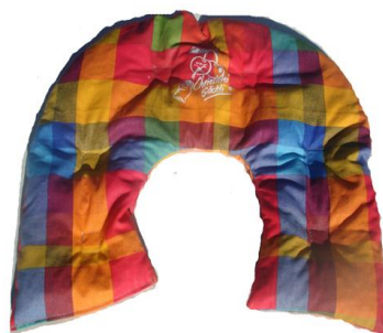
Cervicalino 900gr 27x33cm